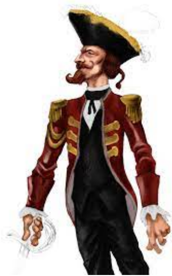
Figura 1: O Barão de Munchausen (Fandom; Domínio público)

As Aventuras do Barão Munchausen , contadas por ele mesmo e com muito humor - ou seja, grandiosas mentiras contada por um adulto - são o grande feito deste livro. E talvez seja exatamente por isso que o público infantil se identifique e se encante com essa narrativa repleta de fatos irrealistas que nos levam pouco a pouco para um mundo mágico e absurdo - no melhor dos sentidos. Convenhamos: uma boa