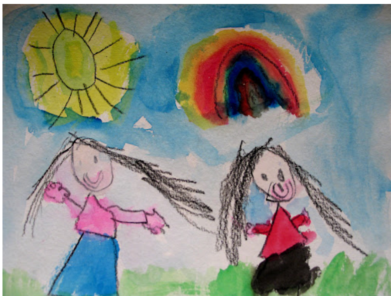
Figura 9: Depois de eles elaborarem a aventura em conjunto, coloque as cadeiras em uma grande roda e certifique-se de que as peripécias criadas sejam contadas com a participação de todos os estudantes do grupo (Aventuras no conhecimento; Domínio público)