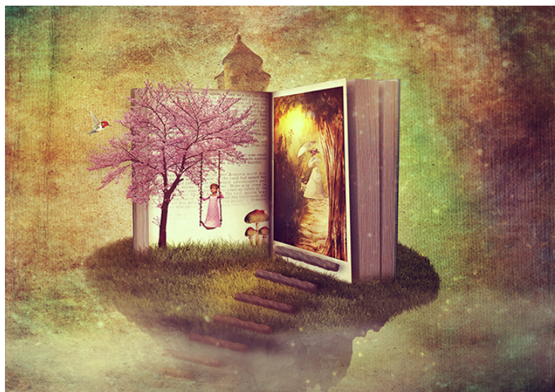
Figura 5: O que define um gênero narrativo é o fato de, não importa qual seja sua forma, contar uma história.

e um conto. Ainda poderíamos falar dos registros de cada subgênero: a epopeia é originalmente um subgênero oral , versificado, e metrificado, já o romance é tradicionalmente escrito em prosa. Desde meados do século XVIII, no entanto, o estabelecimento dos gêneros e subgêneros narrativos tornam-se cada vez menos rígido, com as características cada vez mais fluidas e intercomunicativas.