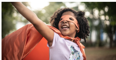
Figura 8: Divida a turma em grupos de até cinco estudantes e desenvolva uma atividade na qual eles serão instruídos a inventar uma aventura por onde passaram

diversão, uma floresta e outros lugares que estimulem a imaginação dos alunos. Mostre alguns artifícios para que uma história se torne mais interessante.