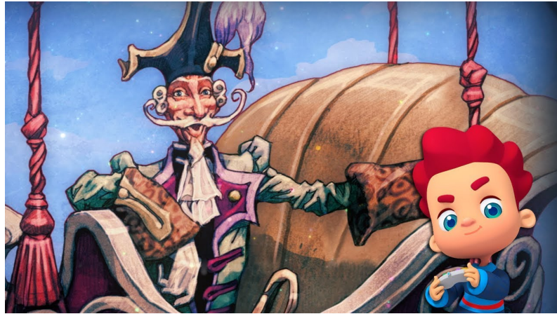
Figura 7: Imagem do canal Lanterna Mágica

Uma vez organizada a sala, comece pedindo-lhes que contem alguma aventura que viveram. Logo em seguida, proponha uma pesquisa sobre livros e jogos que envolvam alguma situação aventureira com que já tenham tido algum contato e estimule que narrem essas histórias, além de ouvir o que os colegas trouxeram. Depois de algum tempo, sugere-se que o professor aproxime as aventuras que eles já viveram do tema que o livro traz.