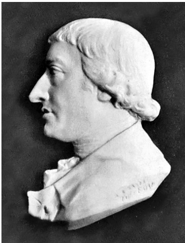
Figura 4: Rudolph Erich

Os primeiros três destes contos foram publicados em 1761. Mas nem todas as histórias reunidas no livro foram contadas na vida real por seu protagonista: Rudolf Erich Raspe criou novas anedotas que atribuiu ao Barão, e diferentes autores adicionaram outros casos nas edições posteriores do livro. Com o tempo, Munchausen tornou-se cada vez mais popular e foi traduzido para muitas línguas e ilustrado por diversos artistas.