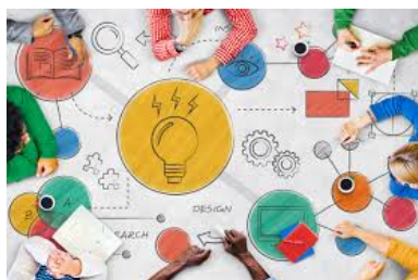
Figura 10: Permita que aflorem a criatividade

oteca para qualquer estudante da escola. Lembre que os alunos podem usar diversos materiais artísticos para a realização da atividade: permita que a criatividade aflore.