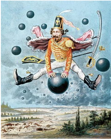
Figura 2: Histórias grandiosas (Meisterdrucke; Domínio público)

mentira contada por um bom contador de histórias atrai leitores de todas as idades.