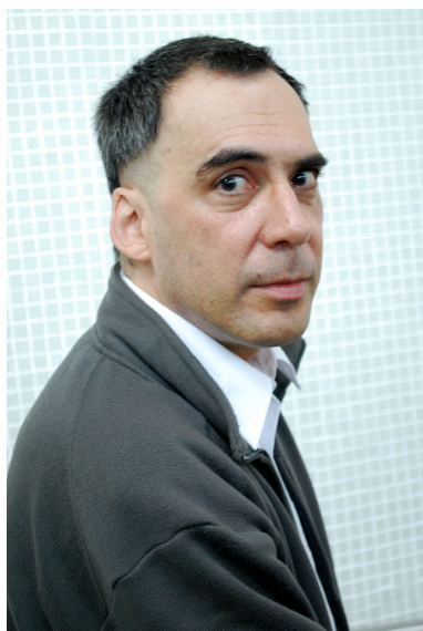
Figura 1: O multiartista Arnaldo Antunes.

descoberta de mundo e das coisas que nos cercam, como se fossem ditas a partir do ponto de vista de uma criança, com uma linguagem simples, direta e objetiva.