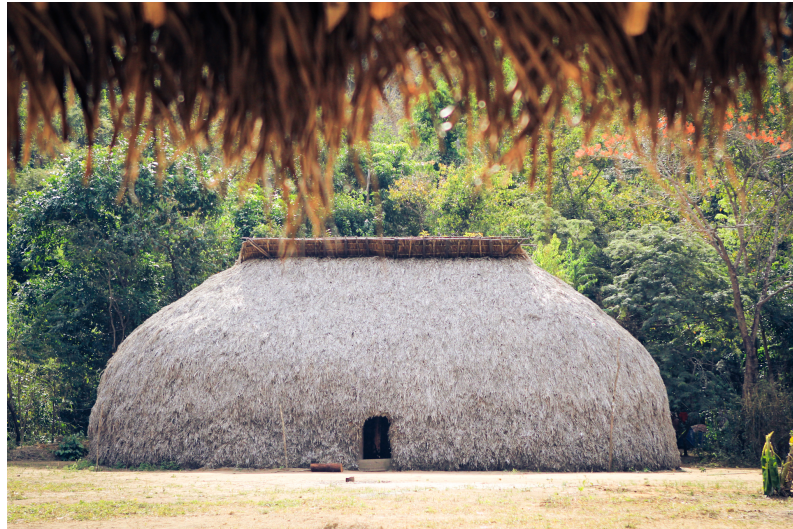
Figura 2: Oka é o tipo de habitação tradicional dos povos Tupi e Guarani que habitam o Brasil. (CC BY 2.0)

De forma mais simples e adequada à etapa de desenvolvimento dos alunos, é imprescindível que eles percebam que a poesia produz imagens que são formas de ver o mundo diferentes da forma convencional. Neste sentido, o olhar poético é sempre um olhar enriquecedor.